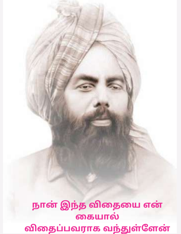
நான் இந்த விதையை என் கையால் விதைப்பவராக வந்துள்ளேன்